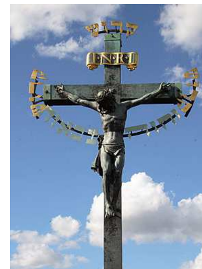
kříž na Karlově mostu s hebrejským nápisem

Libilo by se mi, že křesťanství – na rozdíl od mnohých východních nauk – počítá se světem. Svět pro něj není vězením duchovní stránky člověka, kterým je třeba pohrdat. Oslovilo by mě, že křesťanství