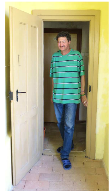
Pan Jaro ze Slovenska, který obývá bývalou prádelnu fary.