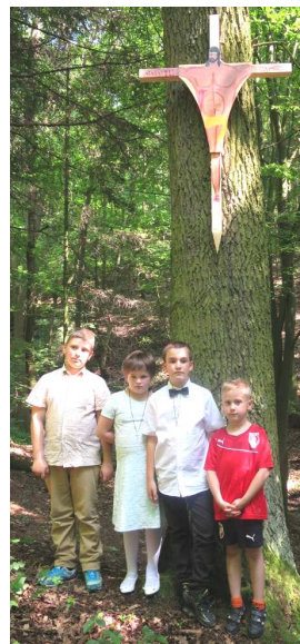
Dva komentáře k fotkám z dýšinské Noci: