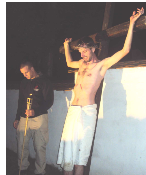
z pašijové hry při dýšinské Noci kostelů