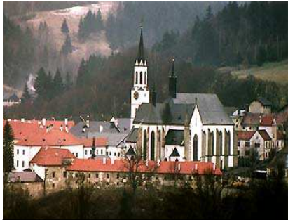
klášter ve Vyšším Brodě

▪ Prosim, hlase se na dovolenou farnosti po poutních místech a kláštrech jižních Čech (1. – 5. srpna) zapsáním do tabulky v kostele nebo na tel. 737 814 525. Budeme bydlet v areálu kláštera ve Vyšší Brodě a ostud podnikat jízdy autobusem po poutních místech a kláštrech: Každý den společná mše sv., ráno a večer nabídka společné modlitby.