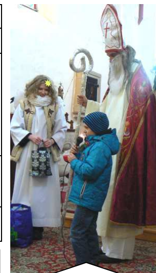
V neděli 9. prosince navštívil dýšinský kostel sám sv. Mikuláš s doprovodem a po mši sv. obdaril děti dárky.