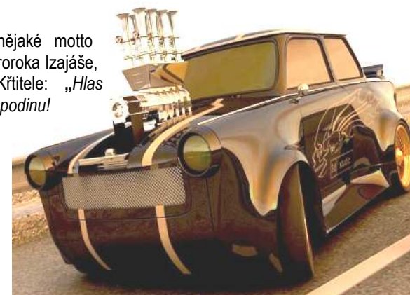
Pod skvělou karosérií se ukrývá obyčejný trabant.