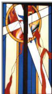
Farní sbor Československé církve evangelické v Chrástu Římskokatolická farnost Dýšina Vás srdečně zvou na