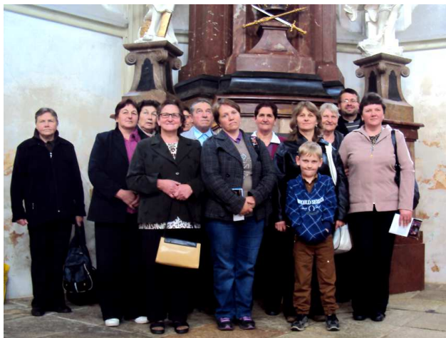
Část naší skupiny před hrobkou českého knížete Vladislava I., který v roce 1115 kladrubský klášter založil

s mnoha kněžími mši sv. Při ní zněla nádherná hudba namíchaná z varhan a trubek.