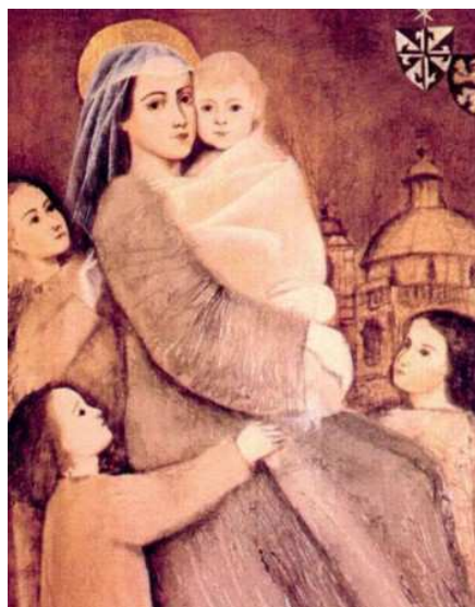
sv. Zdislava z Lemberka – patronka rodin