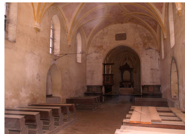
Interiér kostela sv. Jiří v Kostelci, který patří naší farnosti.

Moc prosím, uvědomme si, že chodit do kostela není něco podobného jako chodit do divadla nebo do kina. Pokud představení či film za nic nestojí, pod sedačkami je špína a uvaděčka neochotná, je to pouze a jen problém onoho podniku a my s tím nemáme nic společného. V církvi je to jinak: pokud farnost nefunguje, pokud klesají počty věřících a pokud diecéze nebude mít za pár let na své nezákladnější potřeby, máme s tím velmi mnoho společného. Je to naše záležitost. Církve, diecéze, farnost, to nejsou „oni“, to jsme „my“.