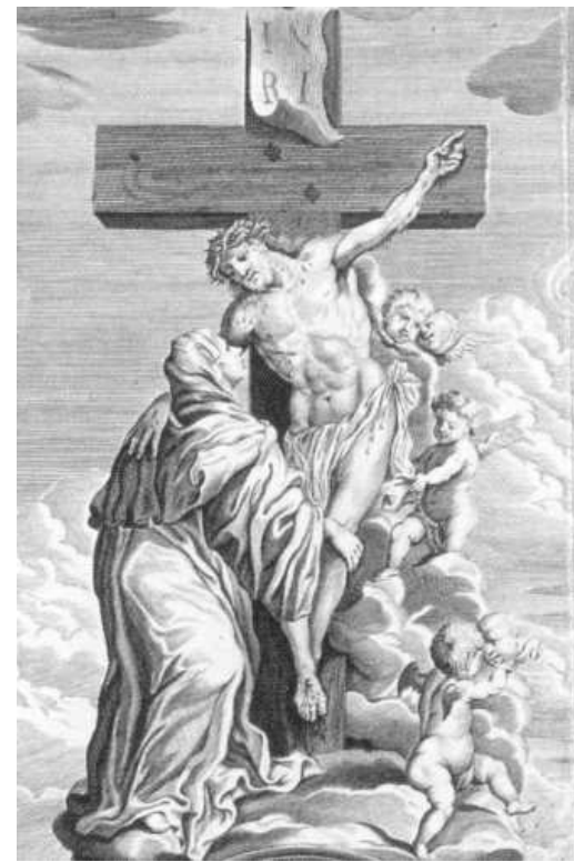
Kristus objímající z kříže sv. Luitgardu

Bylo by krásné takhle postní dobu prožít. Bylo by krásné si tento postoj uchovat i po ní.